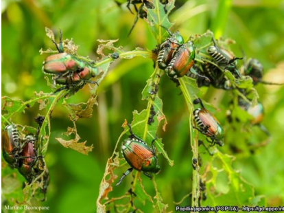
Popillia japonica (adultes et dégâts) - https://gd.eppo.int

Première détection du scarabée japonais Popillia japonica en Bourgogne Franche-Comté – Lien vers le communiqué de presse ICI