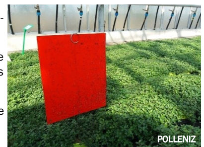
Panneau englué rouge pour la capture des cicadelles