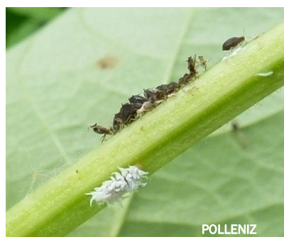
Larves de coccinelle Scymnus sp. (sur les 2 photos)

- Pour en savoir plus sur les pucerons et leurs ennemis naturels : Encyclop'Aphid