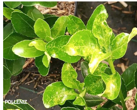
Symptômes d'acariens tétranyques sur Euonymus sp.

Piégeage : panneaux englués rouges au-dessus ou au niveau de la culture.