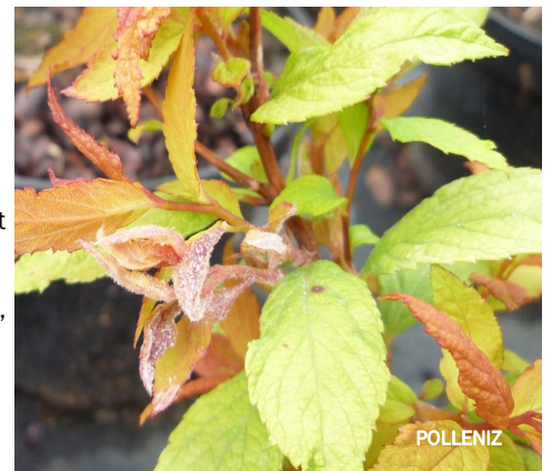
Oïdium sur spirée

Biocontrôle : voir la dernière liste des produits de biocontrôle (lien en fin de BSV).