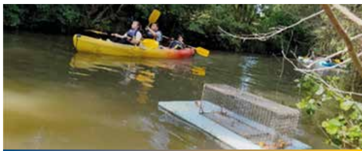
Piégeage le Mans Métropole

DU 10 AU 27 JUIN 2025, POLLENIZ a relevé 90 pièges-cages sur radeaux flottants sur 6 sites différents (Île aux Planches, Île aux Sports, Impasse Louis Crétois, La Gèmerie, Plan d'eau Guy Gaultier et la rivière La Sarthe) appartenant à LE MANS MÉTROPOLE. 16 RAE ont été capturés.