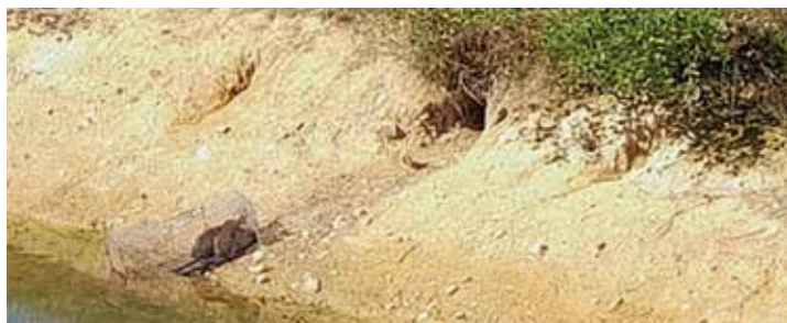
Action de piégeage étang du ruisseau de la Grande Vacherie

Pour cela, 40 pièges-cages ont servi à capturer 21 RAE .