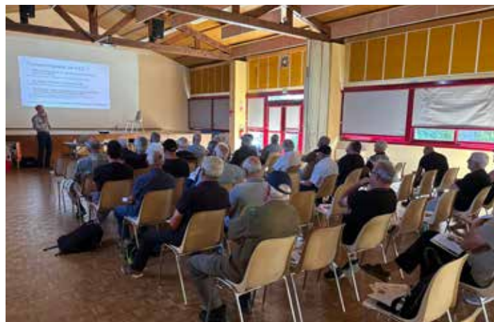
Réunion PEN à Couffé, Loire-Atlantique

Enfin, ces réunions ont été l'occasion de dresser un bilan