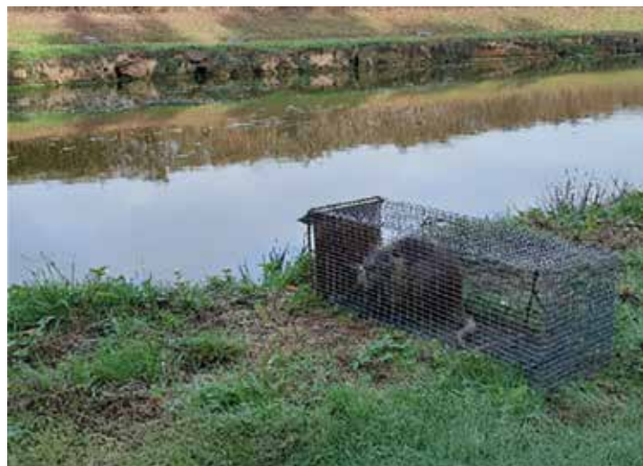
Piégeage Communauté de Communes du Pays de Craon

L'action a nécessité 171 pièges-cages et 82 RAE ont été capturés.