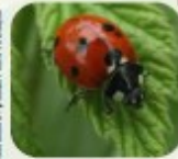
Illustration de la Coccinelle - Pierre de la Cour

Nombreux pollinisateurs, prédateurs, phytophages, consommateurs de nectar ou pollen. Ex : Hérisson commun, charançons, chrysoïdes, coccinelles, etc.