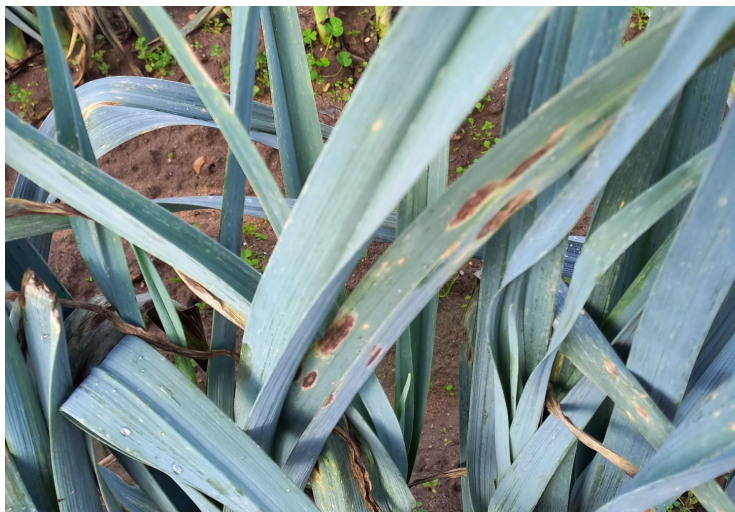
Alternaria sur poireaux