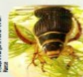
Dytique - Photo de la Cour

Souvent prédateurs aquatiques, Présents dans les mares, fossés, cours d'eau. Peuvent voler d'une zone humide à une autre. Ex : dytiques et hydrophilus