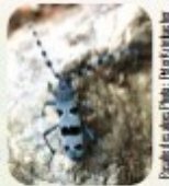
Illustration de la Rosalie des Alpes - Michel Delbecq

Souvent liés au bois mort et vieux arbres à cavités, arbres têtards, haies bocagères. Certains grands coléoptères sont des insectes emblématiques. Ex : Grand capricorne, Rosalie des Alpes, petite biche, etc.