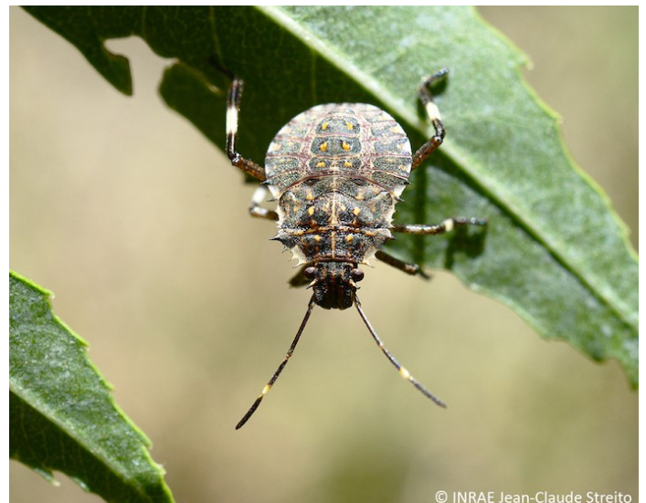
Punaise diabolique au stade larvaire

Pour en savoir plus sur les punaises phytophages, consultez le Hors-série du 28/04/2023 du BSV Arboriculture fruitière Nouvelle Aquitaine en cliquant sur le lien suivant :