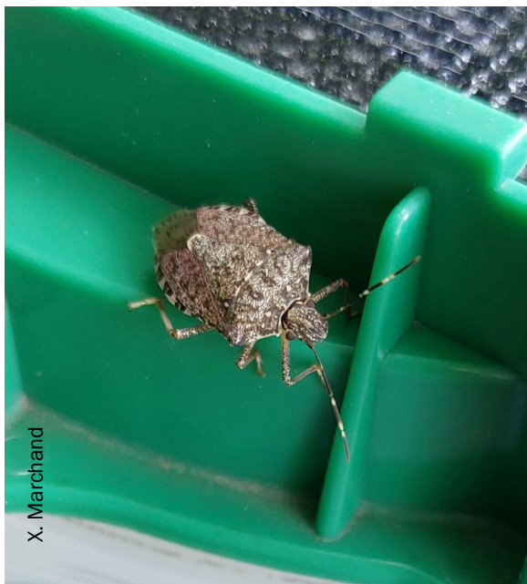
Punaise diabolique adulte (piégée en PDL le 22/09/23)

Si aucun dégâts n'est encore à déplorer en vergers dans les Pays de la Loire, des dégâts conséquents sur fruits sont constatés en Savoie/Haute-Savoie. Ils atteignent 10 % sur pommiers et jusqu'à 85 % sur une parcelle de poiriers !