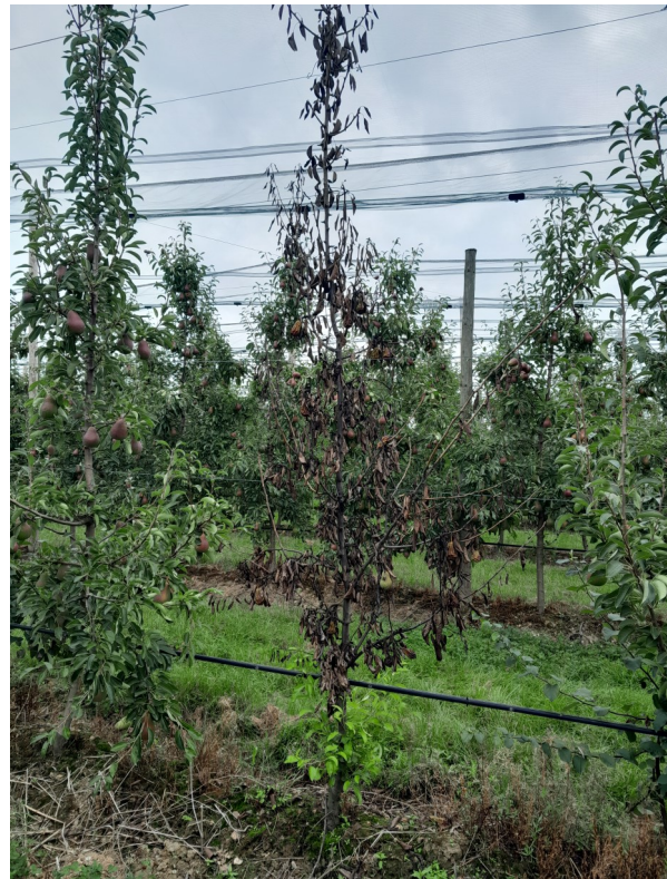
Feu bactérien / poirier : dessèchement d'un rameau, puis propagation rapide et mort de l'arbre.