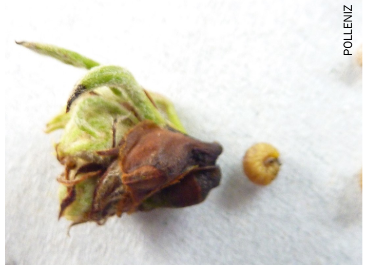
Larve d'anthonome du poirier

Les anthonomes du poirier sortent la nuit jusqu'au début du jour, et se cachent en journée. Les observations sont donc à réaliser le matin, lorsqu'ils sont actifs (s'alimentent et pondent).