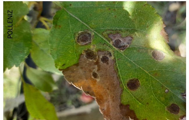
Mines sur feuilles de pommier

Les mines sont généralement peu pénalisantes pour l'arbre mais la mineuse cerclée est règlementée pour l'exportation vers les Etats-Unis où son introduction n'est pas autorisée.