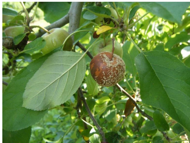
Fruit avec moniliose

En verger, les symptômes apparaissent pendant l'été et l'automne avant la récolte sur les fruits à la faveur de blessures diverses (morsures de tordeuses, de forficules, de guêpes, dégâts de carpocapse, coups de bec d'oiseaux, grêle, fortes pluies...) : ce sont des pourritures fermes, brunes plus ou moins foncées, formant lorsque les conditions sont favorables (humidité) des coussinets bruns en cercles concentriques.