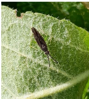
Adulte d' Heterotoma

Des acariens prédateurs ainsi que des punaises prédatrices des genres Atractotomus et Heterotoma (adultes et larves) sont présents et actifs dans les vergers. (Cf BSV n°13 pour la description de ces auxiliaires)