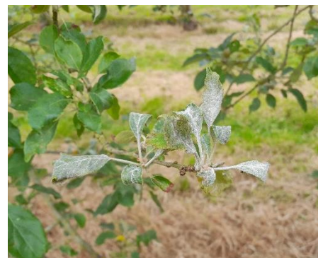
Oïdium sur Douce Moën

Des dégâts sur les pousses de l'année sont présents sur des variétés plus ou moins sensibles : Douce Moën, Judeline, Judaine, Petit Jaune, Judor. L'intensité est variable entre de rares symptômes et des attaques moyennes à fortes.