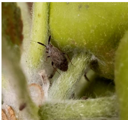
Adulte d' Atractotomus