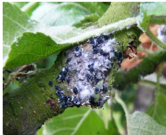
Pucerons parasités par Aphelinus mali

Des foyers entièrement parasités sont observés en Pays de la Loire. En Normandie, des foyers assez bien parasités commencent à être notés.