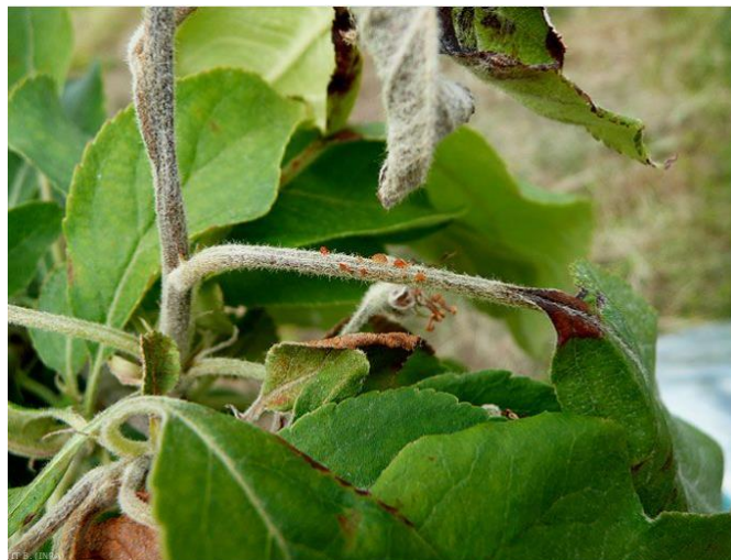
Exsudat sur le pétiole et nécrose sur la nervure centrale de la feuille de pommier - Feu bactérien

Les organes atteints (fleurs, pousses, ...) se nécrosent et noircissent. On observe une production d'exsudat : gouttelette blanc jaunâtre puis ambrée. Ce liquide qui contient la bactérie est collant.