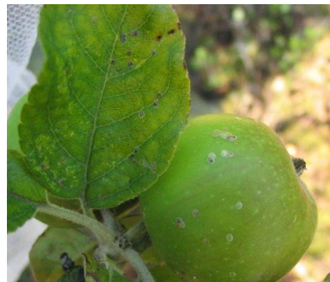
Pontes sur feuille et fruit

Des piqûres sont observées en Normandie et en Pays de la Loire sur les variétés : Judaine, Petit Jaune, Judeline et Debbie.