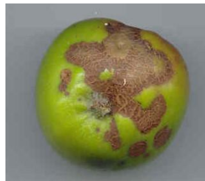
Tavelure sur fruit

https://draaf.normandie.agriculture.gouv.fr/IMG/pdf/bsv_arboriculture-fruits_transformes_bretagne-normandie-pays_de_la_loire_no01_du_22_03_2023_note_abeille.pdf