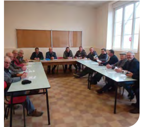
Assemblée du Gdon de Joué en Charnie

En 2021, 263 ragondins exclusivement, ont été capturés. Des actions de régulation des ESOD (Espèces Susceptibles d'Occasionner des Dégâts) sont mises en place en concertation par secteur.