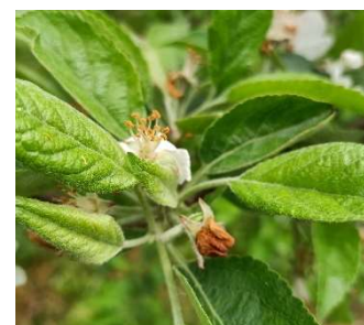
Dégâts d'anthonome : « clou de girofle »

Les dégâts sont pour le moment assez faibles.