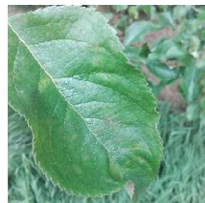
Taches de tavelure

Le risque est nul pour ces prochains jours car aucune précipitation n'est prévue.