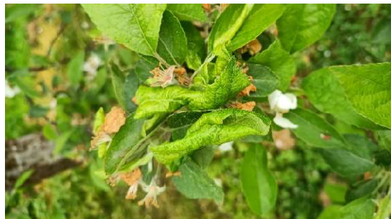
Feuilles enroulées à cause des pucerons cendrés