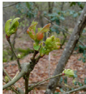
Formation de la galle au moment du débourrement du châtaignier

A partir de fin juin à août : les adultes émergent et s'envolent.