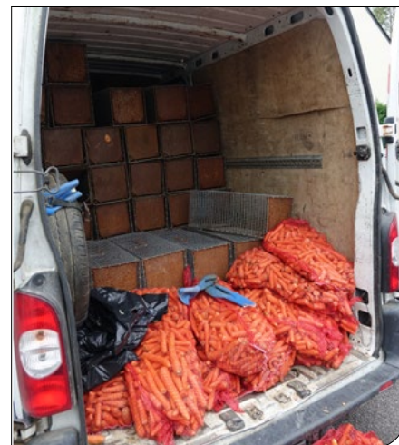
Pièges-cages et appâts mis à disposition des bénévoles

L'opération a pris fin le 25 septembre lors de la restitution des cages à Polleniz ainsi que la présentation et le comptage des preuves (voir encadré ci-dessous).