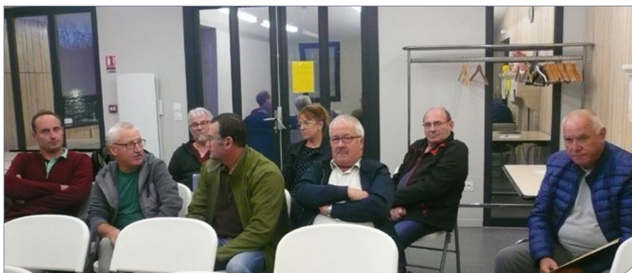
Près d'une dizaine d'opérateurs ont participé à la réunion de mise en place d'une OCB de lutte RAE pour le secteur de Sud-Vendée, mardi 15 octobre à Maillé (85).