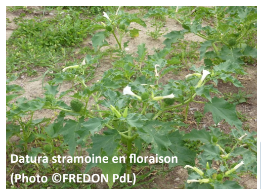
Datura stramoine en floraison

Pour plus de conseils, consulter le flash sanitaire 41 .