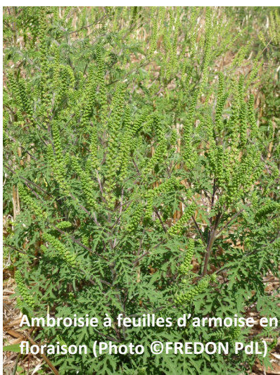
Ambrosie à feuilles d'armoise en floraison

Le mois d'août est là, l'Ambrosie à feuilles d'armoise, la Berce du Caucase ou encore le Datura stramoine, fleurissent. Ces trois espèces exotiques envahissantes sont des espèces posant des problèmes de santé publique !