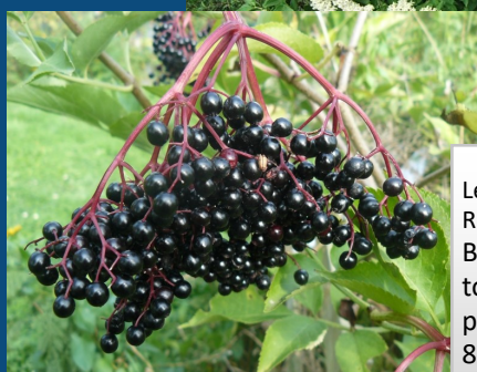
Le Sureau noir en floraison Baies du Sureau noir

La plupart d'entre vous connaît l'espèce sauvage présente dans nos campagnes et la plus commune : le Sureau noir ou Sureau commun ( Sambucus nigra ). C'est le bon sureau. C'est le plus grand (jusqu'à 6 m de hauteur).