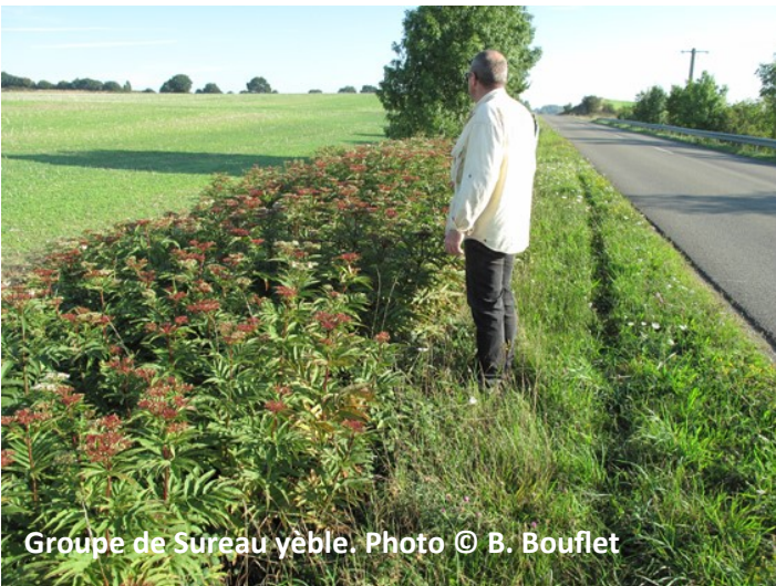
Groupe de Sureau yèble.

Ses baies noires et toute la plante sont très toxiques. Les symptômes décrits sont des diarrhées, des douleurs abdominales, parfois des vomissements, voire si ingestion massive : une mydriase et des vertiges.