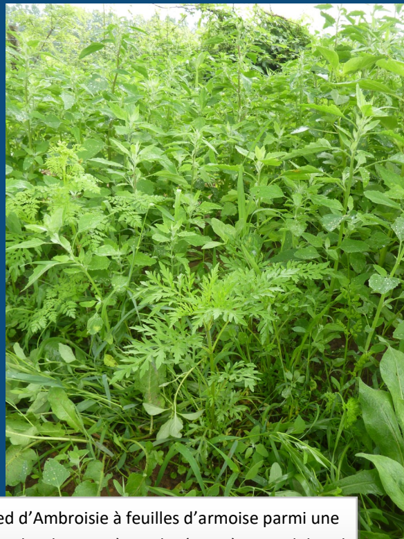
Pied d'Ambroisie à feuilles d'armoise parmi une flore locale, suite à une levée après travail du sol pour la création d'un massif.