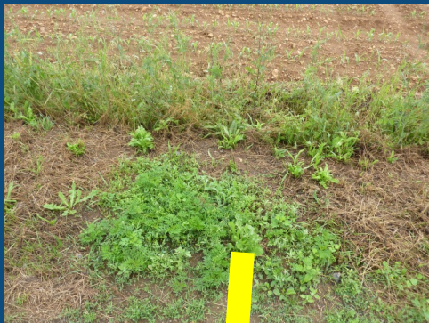
Ambroisie à feuilles d'armoise dans la saignée d'un accotement d'une route communale (Parcé sur Sarthe), le long d'une culture de maïs (photos gauche) ; parcelle de tournesol envahie par l'ambroisie